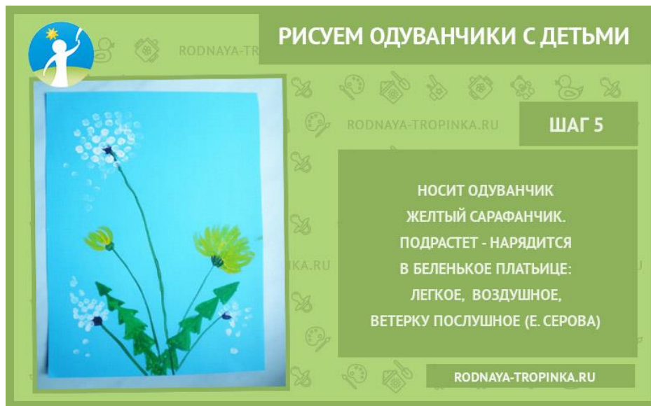
Рисунок готов! Хорошего всем лета! Несмотря на то что во многих регионах оно в этом году холодное, дождливое, нас могут порадовать рисунки с такими солнечными цветами! Удачи вам в творчестве и хорошего летнего отдыха!